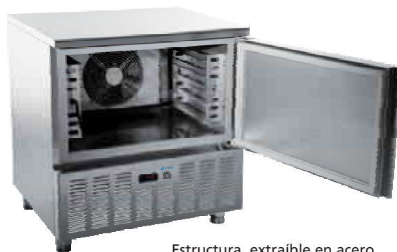
Estructura extraíble en acero inoxidable con 5 guías para bandejas GN 1/1.