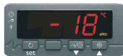
Termostato con display de leds y control de ciclos.